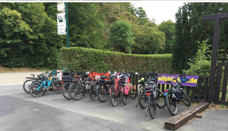
Verdiente Pause in Schuld bei der Radtour auf dem Ahrtal-Radweg am 31.07.2019